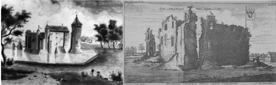
Kasteel en ruïne Cranendonck

En zo hebben we de connectie compleet. In rechte lijn, via de man of via de vrouw, 24 generaties, gerekend vanaf Arnold van Stein en Elisabeth van Valkenburg. Ik durf met dit overzicht te beweren dat door de aderen van onze koning Willem Alexander nog steeds bloed stroomt van onze eerste Heren van Stein. Mocht u twijfels hebben, dan raad ik u aan zelf de zoektocht te gaan doorlopen.