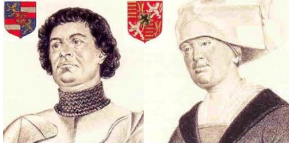
Jan, graaf van Nassau-Dillenburg, en Maria van Loon van Heinsberg, vrouwe van Stein

Wie ooit een rondleiding heeft gehad op de kasteelruïne van Stein, die kan weten dat er een connectie is tussen koning Willem Alexander en Maria van Loon van Heinsberg, vrouwe van Stein (1459), die getrouwd was met Jan, graaf van Nassau-Dillenburg. Jan van Nassau-Dillenburg en Maria van Loon zijn de overgrootouders van Willem van Oranje. Het spreekt voor zich dat er vanuit hen een connectie is met Willem Alexander, die in 2017 50 jaar is geworden.