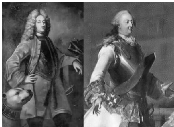
links: Frederik Anton Ulrich, graaf van Waldeck-Pyrmont (1676-1728) rechts: zoon Karel August Friedrich, vorst van Waldeck en Pyrmont (1704-1763)