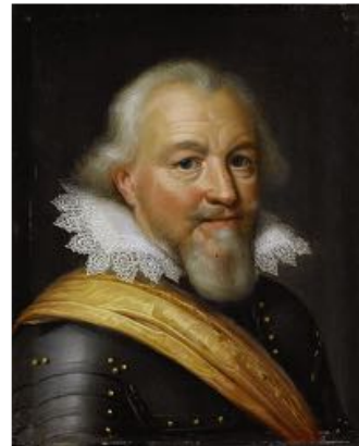
Johan, graaf van Nassau-Siegen (1561-1623)

Uit het huwelijk van Heinrich, graaf van Waldeck-Wildungen, en zijn vrouw Anastasia wordt in 1493 een zoon geboren: Philip, graaf van Waldeck-Wildungen. Hij is achtereenvolgens getrouwd met Margaretha Cirksena, Catharina van Hatzfeldt-Wildenburg en Jutta van Isenburg-Grenzau. Uit dit laatste huwelijk wordt dochter Magdalena van Waldeck-Wildungen geboren. Magdalena is geboren op 9 september 1558 in Siegen in Nordrhein-Westfalen. Zij is in 1573 getrouwd met Philips Lodewijk, graaf van Hanau-Münzenberg, met wie ze vier kinderen heeft. Zij is in 1581 hertrouwd met Johan, graaf van Nassau-Siegen. Deze Johan is op 7 juni 1561 in Dillenburg in Hessen geboren en is een zoon van Jan VI (de Oude) van Nassau-Dillenburg en Elisabeth van Leuchtenburg. Hij is een kleinzoon van Willem de Rijke, graaf van Nassau-Dillenburg, en Juliana van Stolberg.