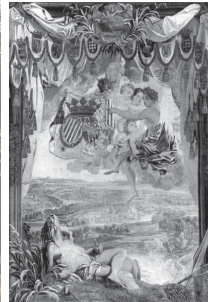
Gobelin van kasteel Stein (18 eeuw) in kasteel Merode

levensgrote en begin 18e eeuwse gobelin laten zien waarop kasteel Stein staat afgebeeld. Al pratende ontstond het idee een keer een bezoek te brengen aan Stein.” En toerisme-ambtenaar Bram Lemmens pakte het idee op en werkte het uit.