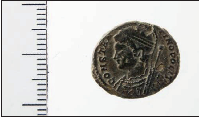
Romeinse munt.

Er is een vondst bij waar ik niks over mag vertellen maar die voor de geschiedschrijving in Limburg zeer belangrijk is. Onderstaande vondst die is aangegeven mag ik wel al delen.