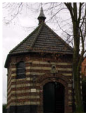
Kapel Maria in de Nood

Heerlijkheid Stein: Binnen de familie van Heinsberg wordt in 1465 overeengekomen de heerlijkheid Stein te verkopen aan Herman van Bronckhorst-Batenburg, een telg van Gelders geslacht met een twistziek karakter. Herman nam volop deel aan de Luikse onlusten op het einde van de 15 e eeuw. In 1489 sluit hij een overeenkomst met de stad Maastricht om vanuit het kasteel van Stein met zijn ruiters haar vijanden aan te vallen en te vervolgen, evenals haar handelswegen te beschermen en te beveiligen. Hoewel in 1492 te Maastricht vrede werd gesloten bleef het land onveilig en werd het garnizoen te Stein gehandhaafd. Herman sterft op hoge leeftijd op 12 februari 1520 te Stein en hij wordt begraven in de grafkelder van de Sint Martinuskerk in Stein.